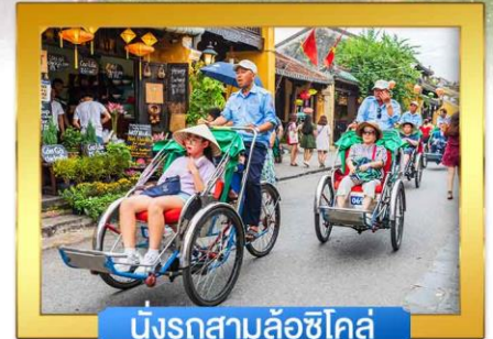
นั่งรถสามล้อซีโคล