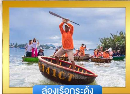
ล่องเรือกระดัง